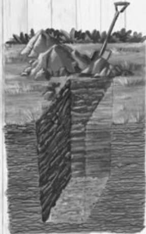
1.80 'ne 2.50 'tëni.