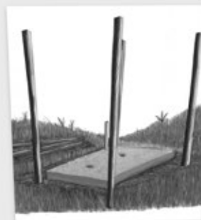
D. Tumin noo kä kubi

Dijún kumno ñooli, chijobe atí kanejú chi jinee ataka kadi kubna ama noo chi je'eñ jinkantay.