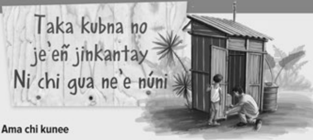
Ama chi kune