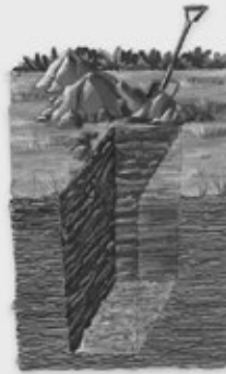
A. Snejú adea ne'e

B. Ataka kanечи kubna nochi je'eñ jinkantay