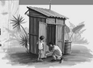
Ama chi kune

Taka kubna no je'eñ jinkantay ni chi gua ne'e nuni.