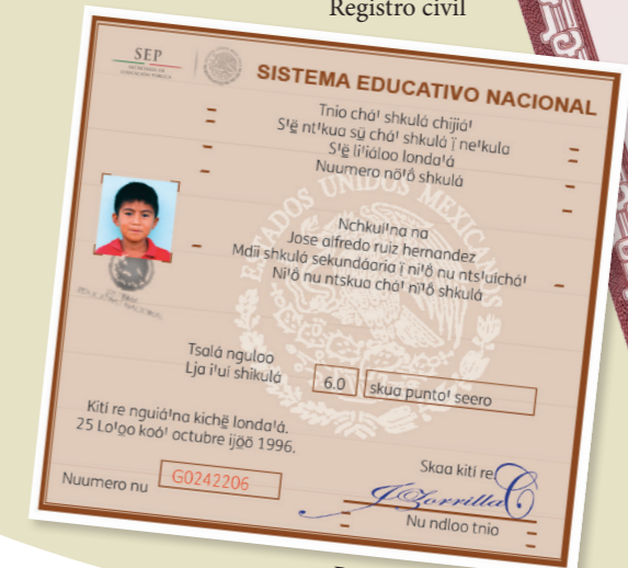
Boleta de calificaciones