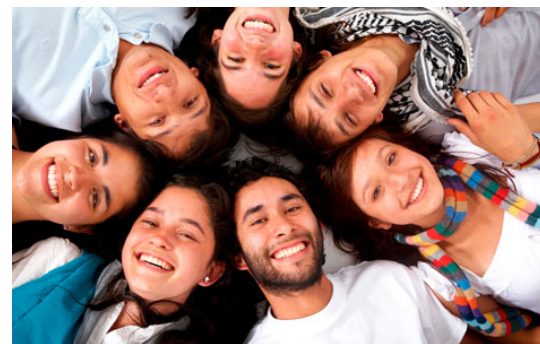
La organización de los círculos de estudio

El instructivo de aplicación, el instrumento de la entrevista, y la hoja de registro.